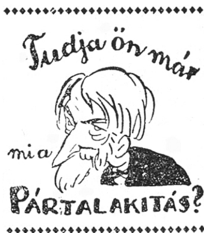
Az Ojság, 1921. február 6., címloldal

Az Ojság későbbi ötleteit ugyanilyen bátornak lehet nevezni, bár a lap szerkesztője valószínűleg nem mindig annak szánta. 'Humorban nem ismert tréfát' – idézhetjük joggal, hiszen Karinthy Frigyes is munkatársa volt –, s ez a lap számára azt is jelentette, hogy hitt a humor erejében, mint amely fegyver az ostobaság ellen, és hitt a politikai véleménynyilvánítás lehetőségében akkor és olyan területen is, amikor és ahol ez alig látszott lehetségesnek. Az eredeti hirdetés polgára 1939 elején csodálkozóra és elképedtre torzított vonásokkal – mert 'csípte a szemét' az ostobaság – azt kérdezte, hogy: „tudja ön már, mi az a fajbiológia?...” Megrettenés helyett elképedt – és a szomszéd hasábján reklám betűkkel, keretben hirdette, hogy „Közéleti szereplése előtt ne felejtse el rendbehozni a családfáját,” 7 egyik címlapi karikatúrájának címe pedig az volt: „Családfa avagy Hány százalékos Edömérke?” 8 A holokauszot átértelmező perspektívájából visszatekintve is lenyűgöző az a kulturált lelkierő, amellyel a kinevetés megsemmisítő erejét demonstrálta – mindaddig, amíg ugyanazon év szeptemberében, ugyanazoknak a képtelen törvényeknek a nevében, mégiscsak betiltották a lapot. A faji törvények következménye volt ez, és nem azé, hogy a sajtórendészeti szervek felismerték volna: más-más formában tulajdonképpen folyamatosan azt kérdezte: „tudja ön már, hogy mi a nemzetiszocializmus?”