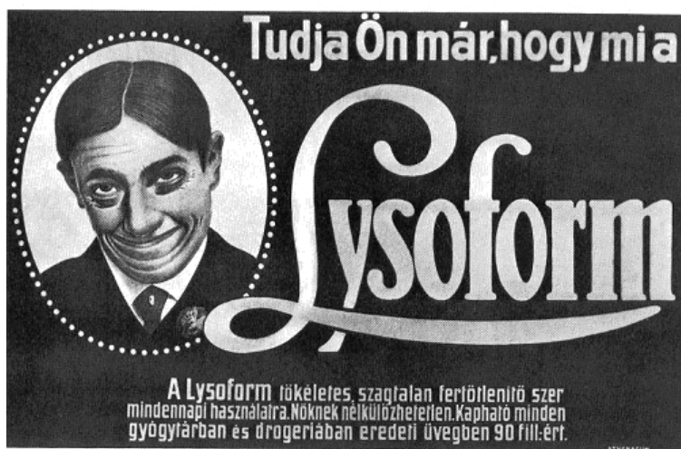
A Lysoform sajtóhirdetése az 1920-as évek közepén

A karikatúra közkeletű szimbólumokat teremt és használ. Ezeket a szimbólumokat – mint napjaink szólásainak, szállóigéinek jelentékeny részét is – előállíthatja egy-egy hatásos hirdetés, plakát, s az aztán önálló életre kel, emblematikus formában egészen más, új jelentések hordozására válik alkalmassá. A rajz és a szöveg együttesen a karikatúra: tehát nem képzőművészeti alkotás, hanem kommentár a tömörítés és a torzítás eszközeivel.