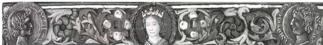
Beatrix arcképe az Agathias-kódex keretdíszében.

Irod: E. PASZTOR, Aragona, Giovanni d' , in Dizionario biografico degli italiani , III, Roma, 1961; Klára PAJORIN, La rinascita del simposio antico e la corte di Mattia Corvino , in Italia e Ungheria all'epoca dell'Umanesi-