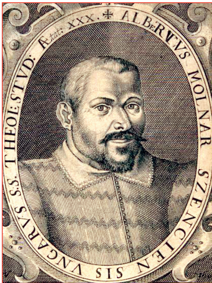
Heinrich Ulrich rézmetszete a harmincesztendős Szenci Molnár Albertről, 1604-ből