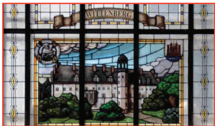
Wittenberg képe a Debreceni Egyetem Aulájának Róth Miksa által festett üveglakán (1938; rekonstrukció: 2010)